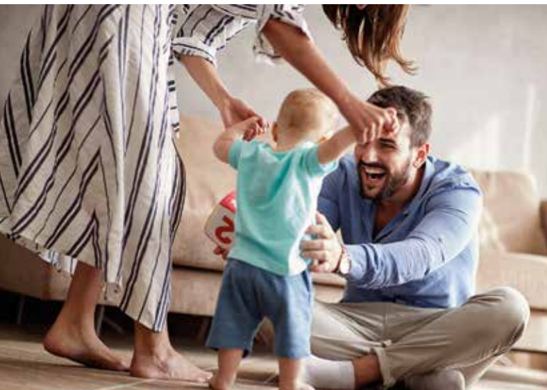
Accueillir les familles.