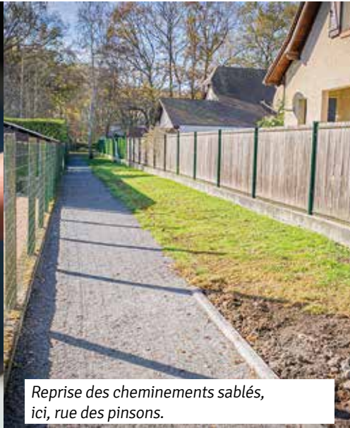
Reprise des cheminements sablés, ici, rue des pinsons.