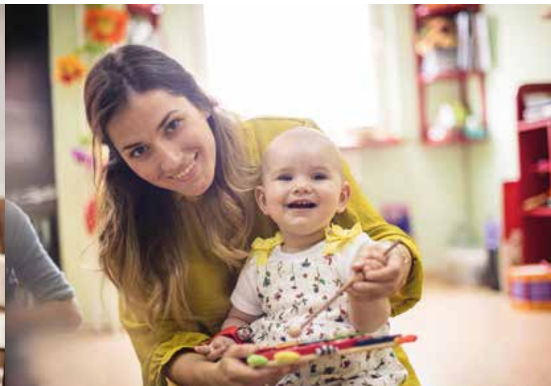
Individualiser l'accueil.