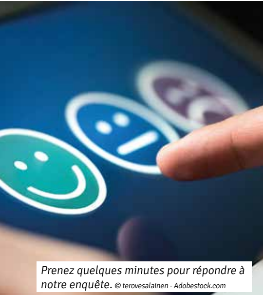
Prenez quelques minutes pour répondre à notre enquête.