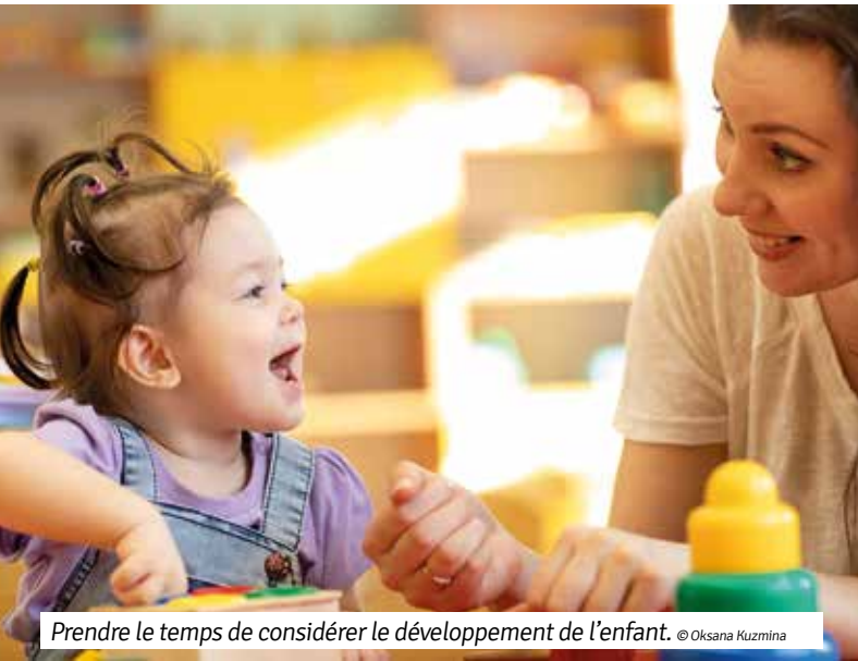
Prendre le temps de considérer le développement de l'enfant.