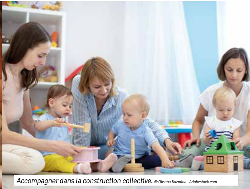
Accompagner dans la construction collective.

d'expérimentation : manger, s'endormir, s'habiller, jouer seul ou avec d'autres.