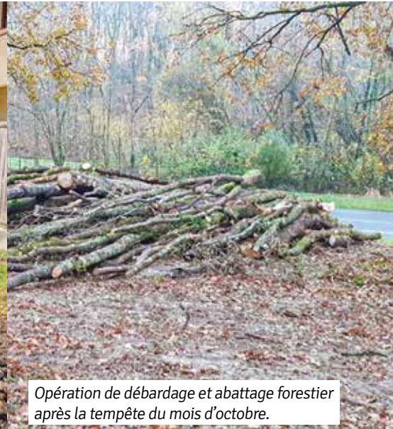
Opération de débardage et abattage forestier après la tempête du mois d'octobre.