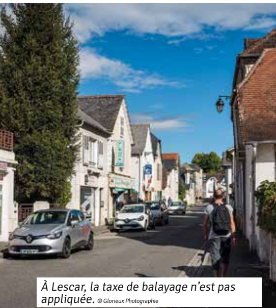
À Lescar, la taxe de balayage n'est pas appliquée.