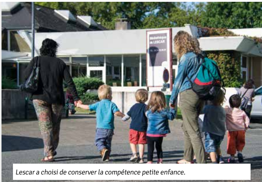
Lescar a choisi de conserver la compétence petite enfance.