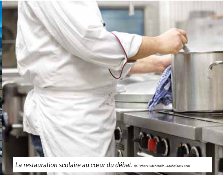
La restauration scolaire au cœur du débat.