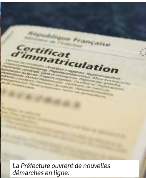
La Préfecture ouvre de nouvelles démarches en ligne.